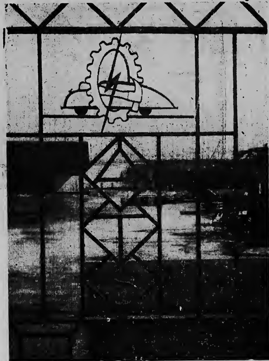
.... Geschoolde krachten, ook des avonds ....